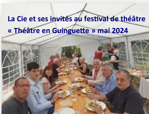
La Cie et ses invités au festival de théâtre « Théâtre en Guinguette » mai 2024

Un bel appartement parisien, doté d'un petit jardin où fleurit un arbre de Judée, est