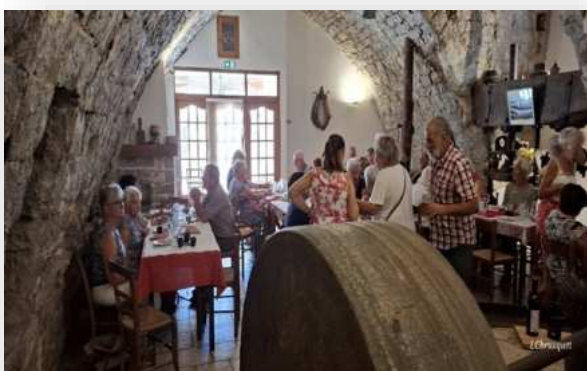
Le repas à l'auberge du Moulin à Villeperdrix.