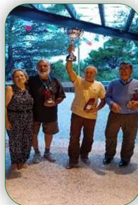
Le trophée « Luigi Musso »