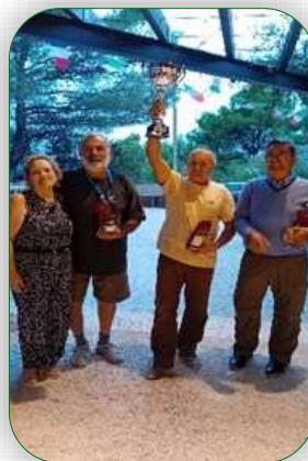
Le trophée « Luigi Musso »