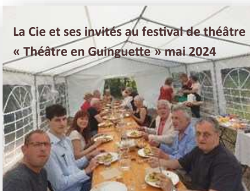
La Cie et ses invités au festival de théâtre « Théâtre en Guinguette » mai 2024

Un bel appartement parisien, doté d'un petit jardin où fleurit un arbre de Judée, est